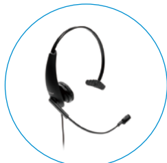
AOBU 標準ヘッドセット